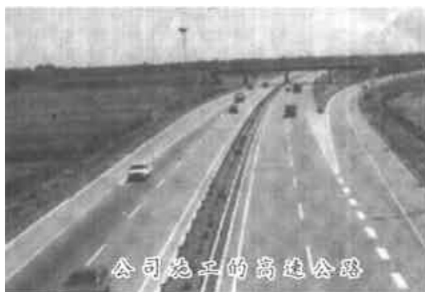
公司施工的高等级公路