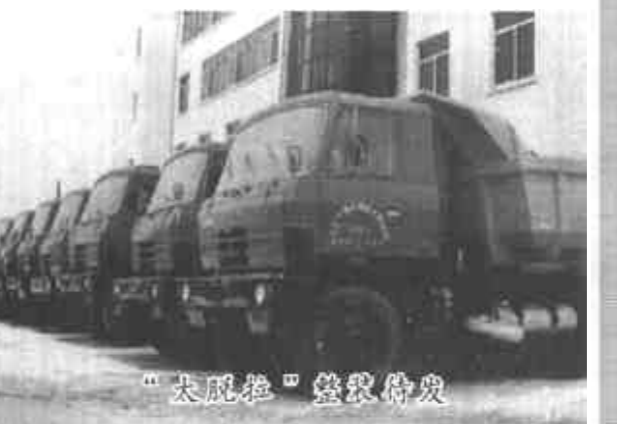
“太脱拉”费格勒沥青