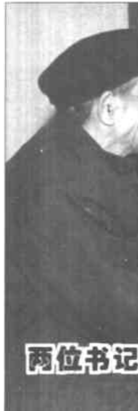
两位书记又有新话题