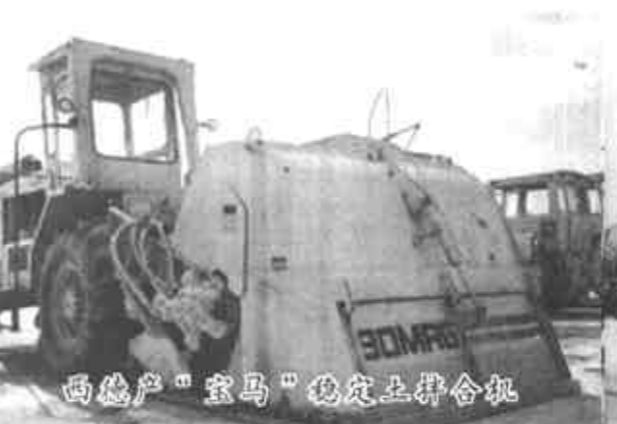
西德产“宝马”稳定土拌料机