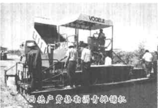
西德产费格勒沥青摊铺机